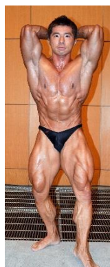
⑦アブドミナル アンド・サイ