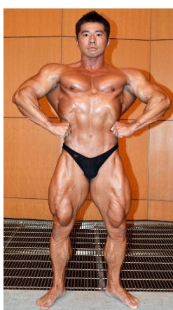
②フロント ラットスプレッド